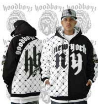
HB College bunda je imidžovka