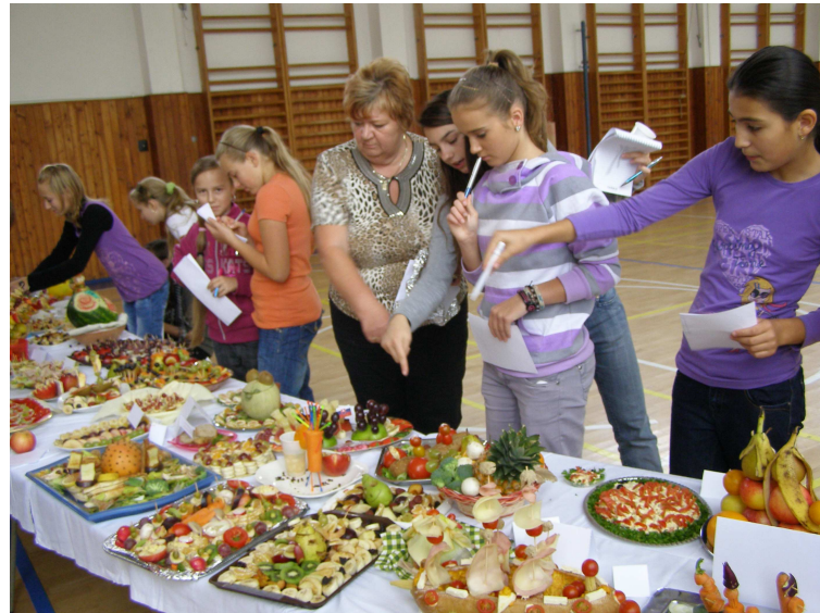
ZDRAVÁ VÝŽIVA (viac na str. 4)