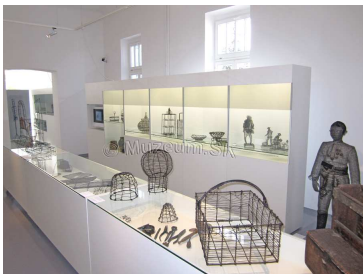
Považské múzeum v Žiline

Dňa 12. októbra 2011 sa žiaci 6., 7., 8., 9. ročníka zúčastnili divadelného predstavenia v Žilinskom divadle. Divadelná ukážka mala názov „Lakomec“. Na začiatku sa nám predstavil Škót pán Harpagón, ďalej jeho rodina, sluhovia a potom...sa príbeh začal. Odohrával sa na lodi a bol plný humoru, ale aj ponaučenia a lásky. Toto predstavenie sa nám veľmi páčilo a na konci zožalo veľký potlesk. Po skončení sme sa presunuli na výstavu do Považského múzea v Žiline. Najskôr sme videli obrazy maliara Vincenta Hložníka a o chvíľu sme sa ocitli vo „svete z drôtu“. Pani sprievodkyňa nás oboznámila s históriou drotárstva. Videli sme ukážky nového aj starého drotárskeho umenia. Po skončení výstavy a po krátkej prestávke sme sa presunuli na vlakovú stanicu a vlakom odcestovali domov. Po chvíli sme boli doma, v našom meste. ☺