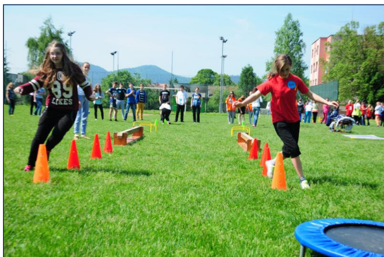
Olympiáda priateľstva (str. 3)